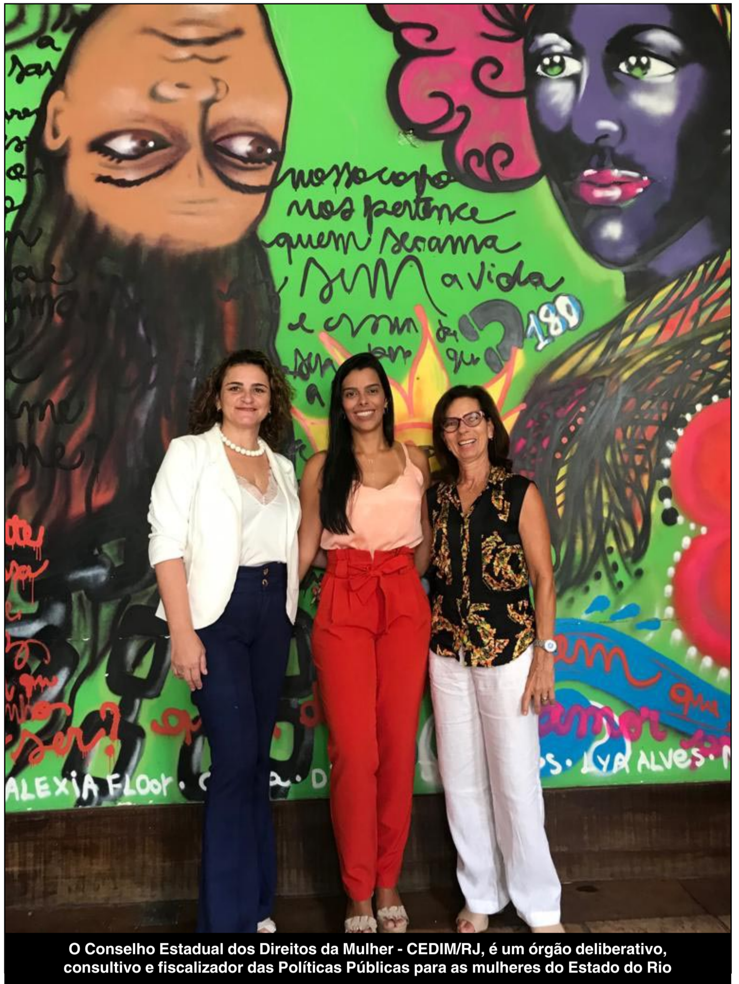
O Conselho Estadual dos Direitos da Mulher - CEDIM/RJ, é um órgão deliberativo, consultivo e fiscalizador das Políticas Públicas para as mulheres do Estado do Rio

DECOM/DEPARTAMENTO DE COMUNICAÇÃO DA PREFEITURA DE ITAPERUNA