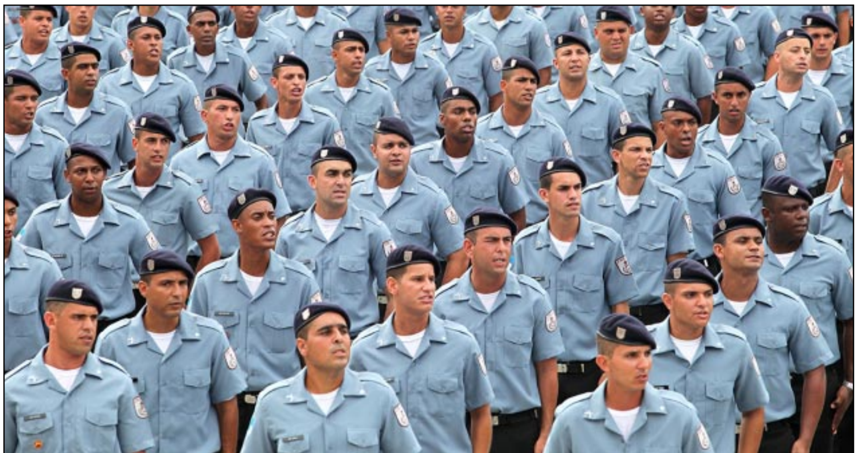
Parte do orçamento do Legislativo permitirá convocação de novos policiais militares e civis

■ A Prefeitura de Itaperuna, através da secretaria de Saúde, Vigilância em Saúde e Ambiental, em parceria com a UFF - Universidade Federal Fluminense, de Uberlândia, realizaram durante esta semana uma ação de prevenção e monitoramento com pesquisa de campo para identificação e controle da bactéria que causa a Febre Maculosa Brasileira. PÁGINA 5