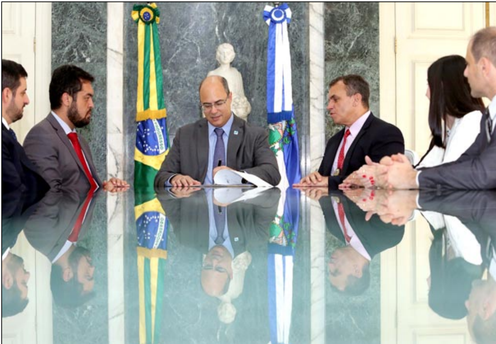
Para reforçar os quadros da secretaria, governador anunciou que haverá novo concurso para contratar mais mil policiais civis

- Esse é o primeiro passo. Vamos fazer um estudo de viabilidade financeira e levar ao Conselho, para dar o passo seguinte - ressaltou.