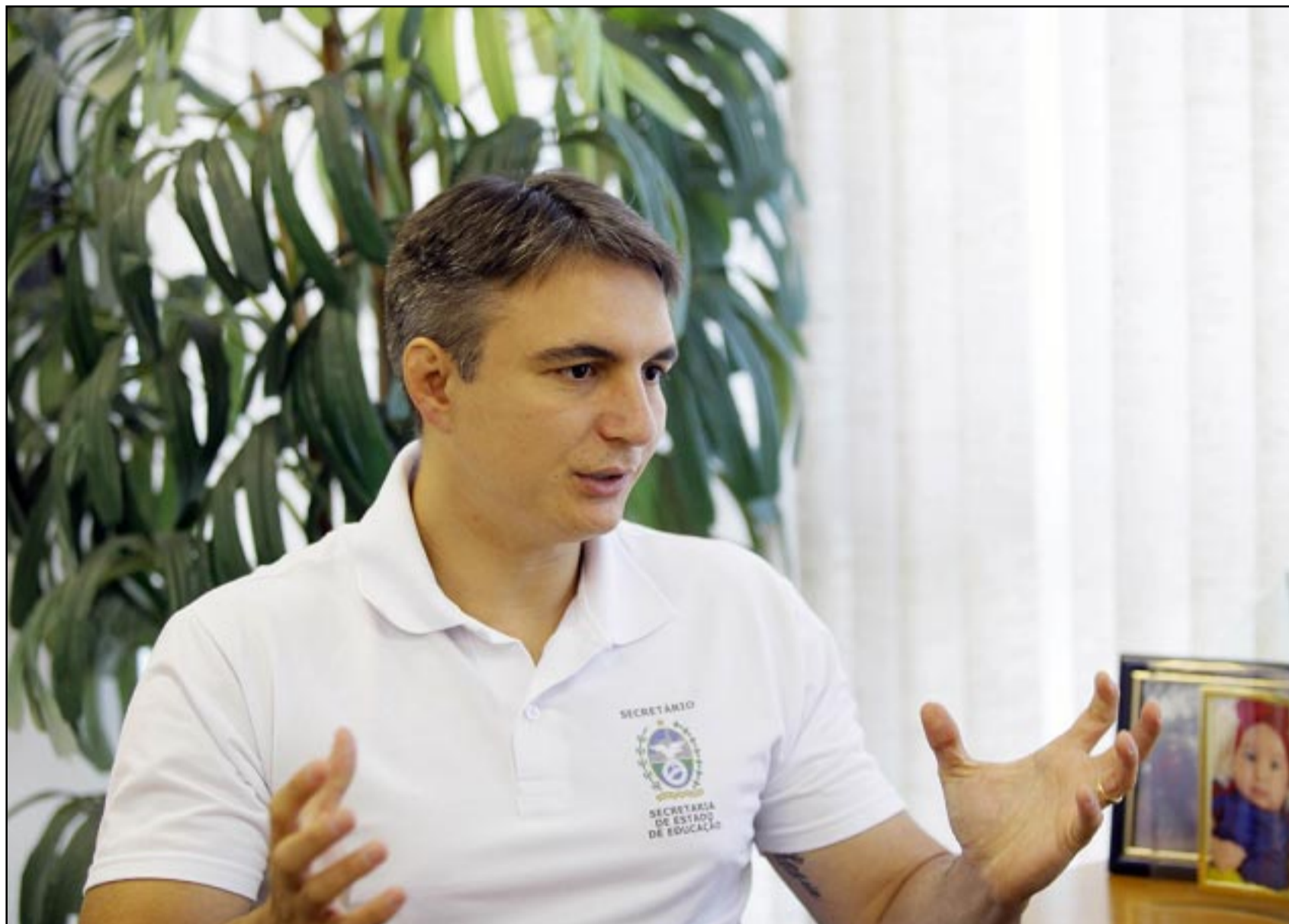
Entre as prioridades está a redução do déficit de professores

QUALIFICAÇÃO DE PROFISSIONAIS - A qualificação e a formação continuada de professores é outro tema incluído na lista de