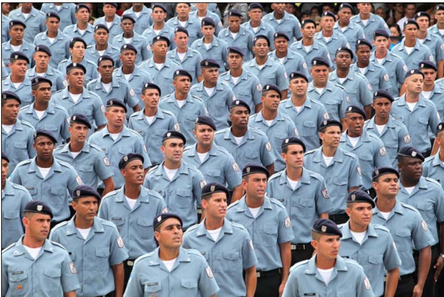
Parte do orçamento do Legislativo permitirá convocação de novos policiais militares e civis