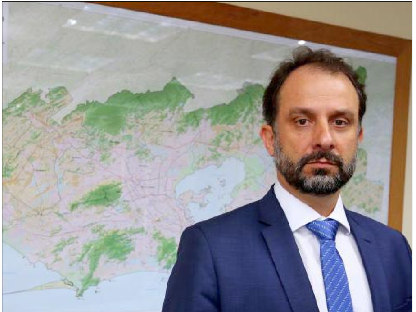
Luiz Claudio Rodrigues de Carvalho, secretário de Estado de Fazenda do Estado do Rio de Janeiro, disse que desde o início do ano, volume de recursos encaminhados aos municípios chega a R$ 1,24 bilhão

Os repasses aos municípios do tributo IPVA são liberados com base na Lei Estadual nº 2.877, de 22 de dezembro de 1997, e na Lei Federal nº 11.494, de 20 de junho de 2007.